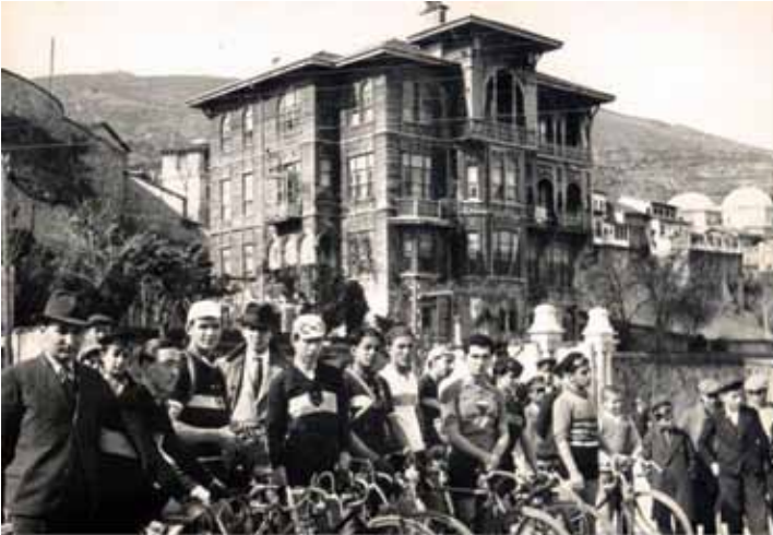
* Halkevi'nin Düzenlediği Bisiklet Yarışması - 1940

Bursamıza ihtiyacı olan bir meydan kazandırma fikri ile yola çıkılmasına rağmen, alan artık meydan olmaktan çıkmıştır. Meydan bir kent boşluğudur ve onu çevreleyen yapıları, mahalleleri, yolları, yeşil alanları, orada hareket edecek insanların ve araçların davranışlarını hesaba katarak tasarlanmalıdır.